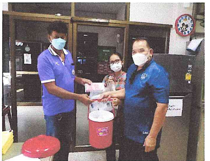
หัวหน้าส่วนราชการ อบต.หนองหว้า มอบวัคซีนพร้อมอุปกรณ์ในการฉีดวัคซีนโรคพิษสุนัขบ้า ให้กับตัวแทน/อสม./อาสาสมัครสาธารณสุข ที่ประสงค์ขอรับวัคซีนไปฉีดให้สุนัข-แมว ในหมู่บ้านของตนเอง