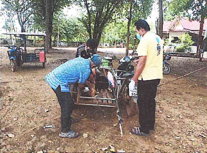
วันอังคารที่ ๖ กันยายน ๒๕๖๕ จนท.อบต.หนองหว้า ร่วมกับอาสาปศุสัตว์ในพื้นที่ ออกให้บริการฉีดวัคซีนโรคพิษสุนัขบ้า ณ วัดหนองโสน เพื่อบริการประชาชนในพื้นที่ หมู่ที่ ๓, หมู่ที่ ๔, หมู่ที่ ๑๓, หมู่ที่ ๑๙ และหมู่ที่ ๒๕