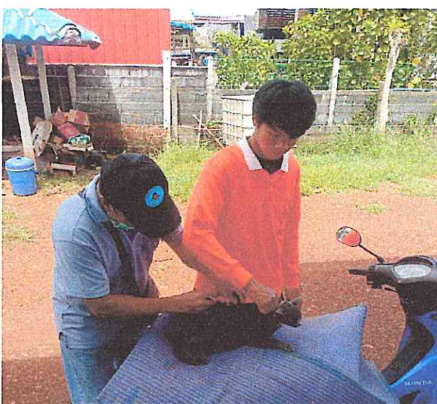
ตัวแทน/อสม./อาสาสมัครปศุสัตว์ ฉีดวัคซีนโรคพิษสุนัขบ้าให้กับสุนัข-แมว ในหมู่บ้านของตนเอง