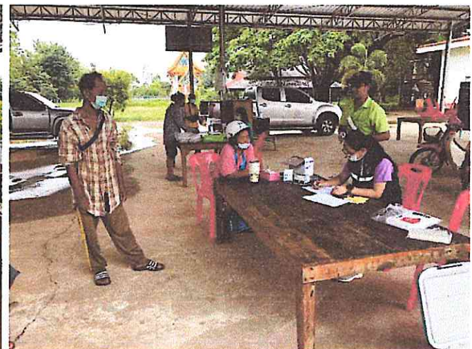
วันพุธที่ ๗ กันยายน ๒๕๖๕ จนท.อบต.หนองหว้า ร่วมกับอาสาปศุสัตว์ในพื้นที่ ออกให้บริการฉีดวัคซีนโรคพิษสุนัขบ้า ณ วัดหนองหว้า เพื่อบริการประชาชนในพื้นที่ หมู่ที่ ๕, หมู่ที่ ๑๑, หมู่ที่ ๒๓, หมู่ที่ ๒๔ และหมู่ที่ ๒๘